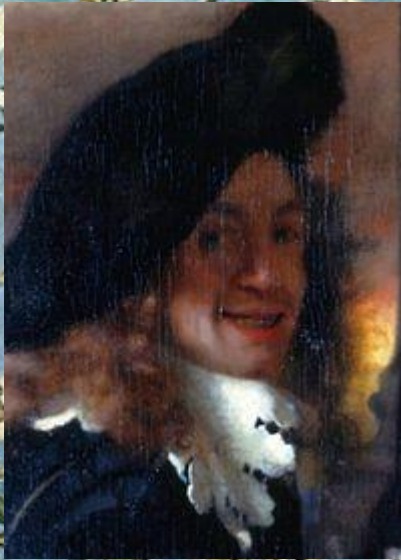
Possible autoretrat del Johannes Vermeer

Les obres més reconegudes d'en Johannes Vermeer són, la que hem representat nosaltres, "La Noia de la Perla" i "Vista de Delft". Va pintar 37 quadres en els seus 43 anys d'edat,